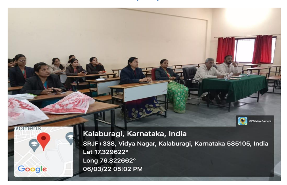
Paper presentation by Dept. of Civil Engineering