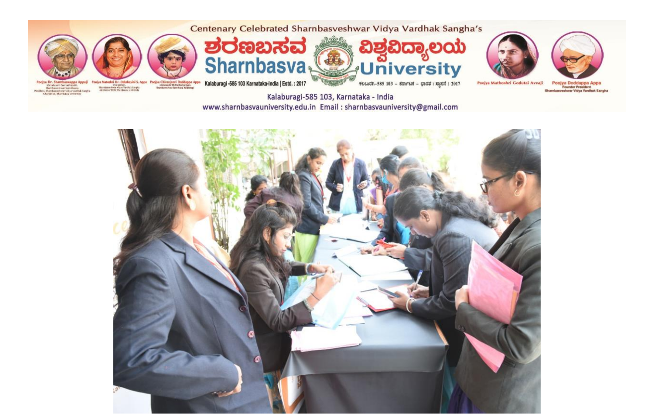
Registration held on the day of "national Research Conference, Business Management, Sciences, Humanities & Social Science-2022"(NRCEBSHS-2022)