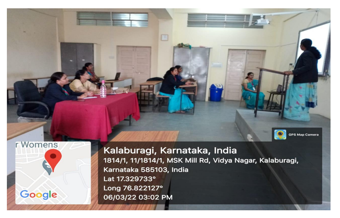
Parallel Presentation by faculty of Business Studies