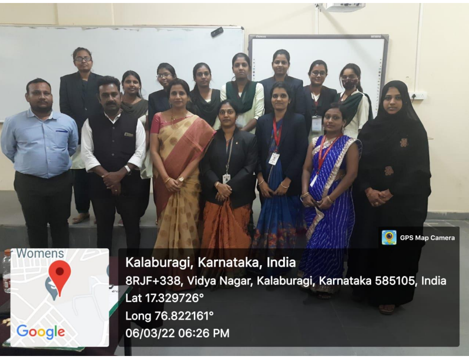
Paper presentation by Dept. of Electronics and Communication Engineering