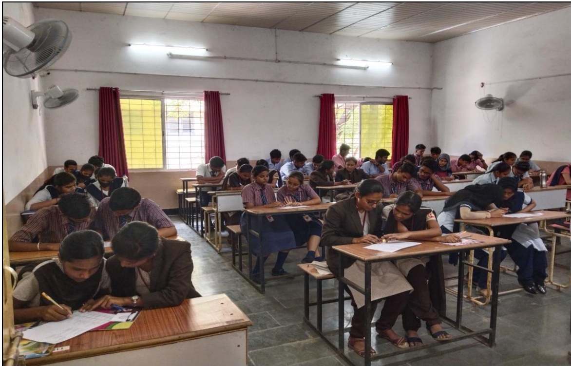
Participants in Preliminary Round